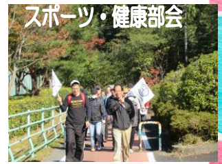
スポーツ・健康部会